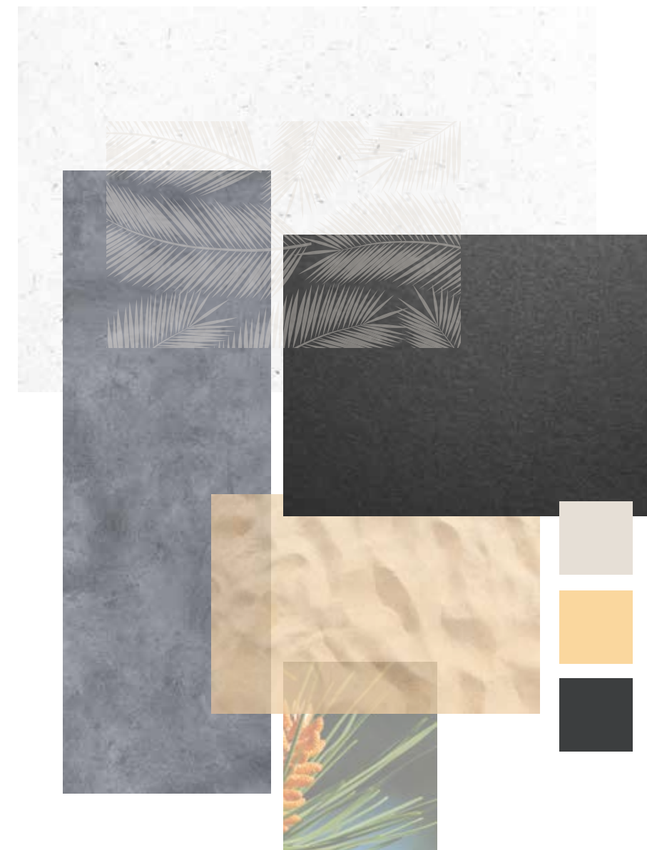
Image non contractuelle à caractère d'ambiance

Le parking privatif en sous-sol laisse place, en surface, à des aménagements paysagers soignés et de très grande qualité.