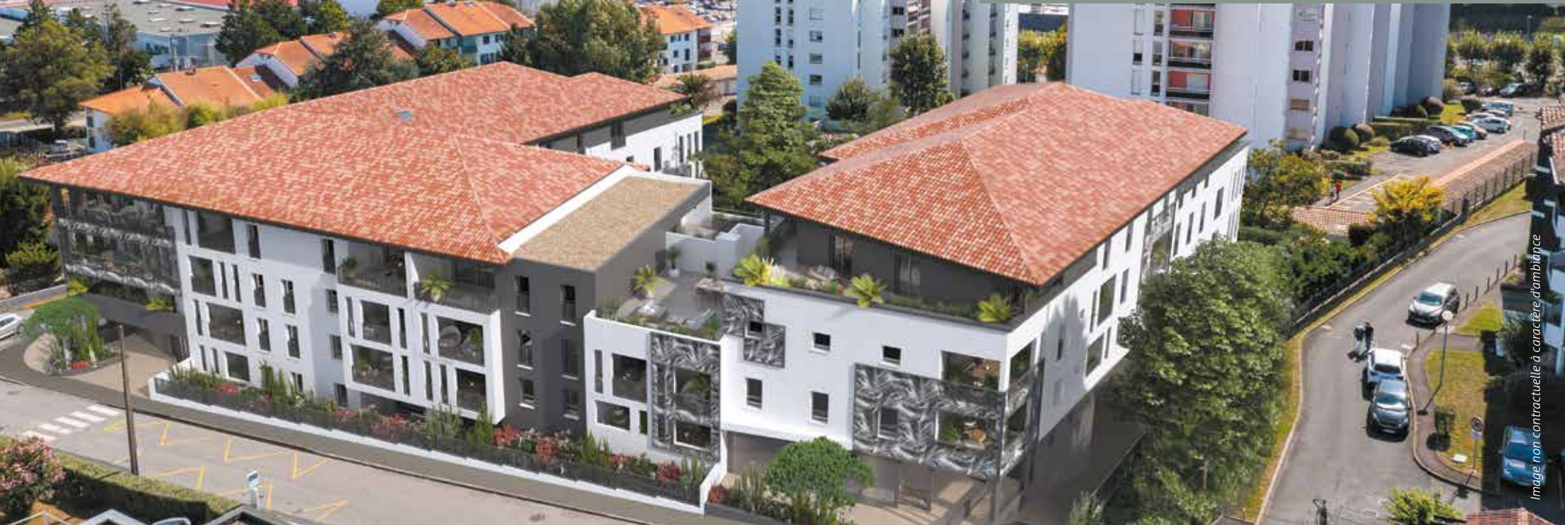
Image non contractuelle à caractère d'ambiance

Située au cœur d'Anglet, bordée par Bayonne d'un côté et Biarritz de l'autre, la résidence Corisande est à moins de 2 km du centre-ville anglois et du marché de Quintau. Voisin du centre commercial BAB2, le quartier regorge également de commerces, de services et d'équipements sportifs.