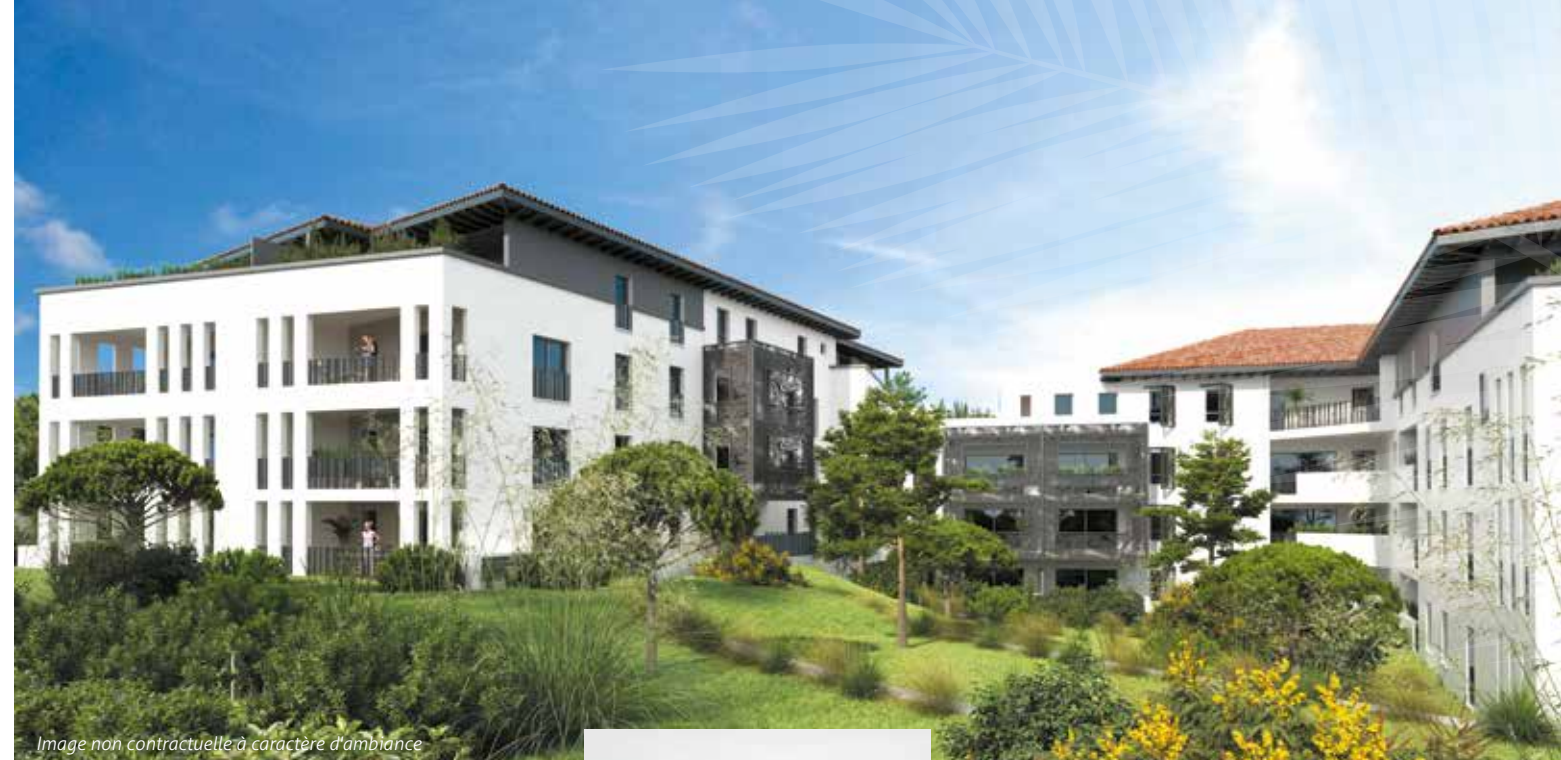
Image non contractuelle à caractère d'ambiance

E nvie de shopping, de balade dans le petit Bayonne ou d'admirer une nouvelle fois Le Rocher de la Vierge ? C'est simple, il suffit de monter dans le Trambus au pied de la résidence. En quelques minutes, la Ligne T1 vous mène directement Place des Basques dans le centre historique de Bayonne ou, en sens inverse, vers le front de mer Biarrot. Des destinations aussi agréables qu'accessibles et cela en quelques stations !